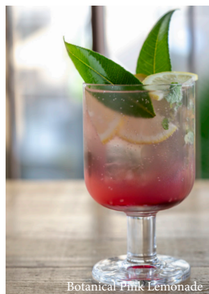
Botanical Pink Lemonade