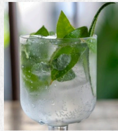
ハーバルモヒート